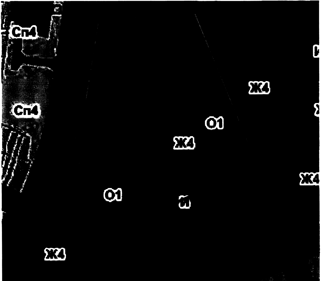
СХЕМА границ территории проектирования

Приложение № 1 к постановлению администрации города Владимира от 22.10.2024 № 2379