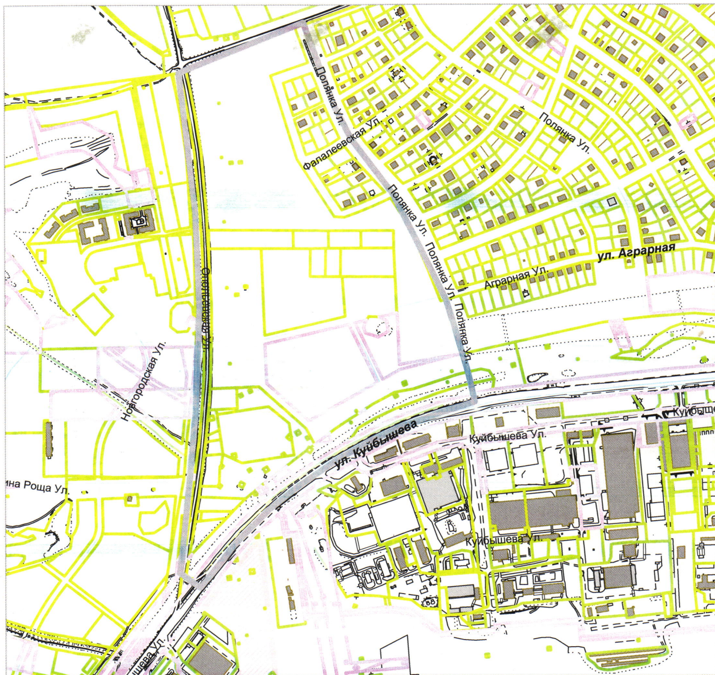
Схема границы территории для проведения публичных слушаний