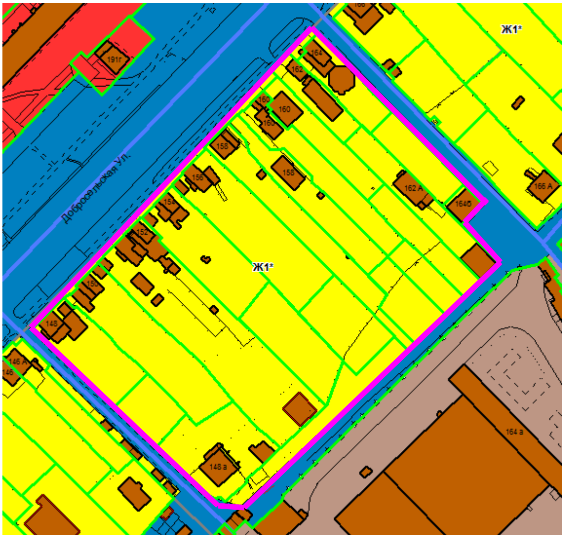
СХЕМА границ территории проектирования

Приложение № 1 к постановлению администрации города Владимира от 14.05.2024 № 1019