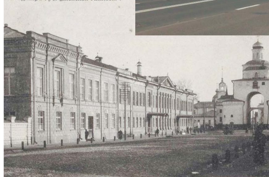
Владимир губ. «Женская гимназия».

Анализ результатов ЕГЭ показывает высокий уровень подготовки. В этом году среди учащихся 11-х классов высокие результаты (80 баллов и выше) по русскому языку показали семь школьников, по обществознанию - три школьника, по английскому языку — три школьника, по истории и химии - по одному школьнику. В этом учебном году среди выпускников 11 класса оказалось три медалиста. С каждым годом увеличивается число учащихся, которые занимают призовые места в муниципальных этапах Всероссийских предметных Олимпиад по литературе, истории и обществозна-