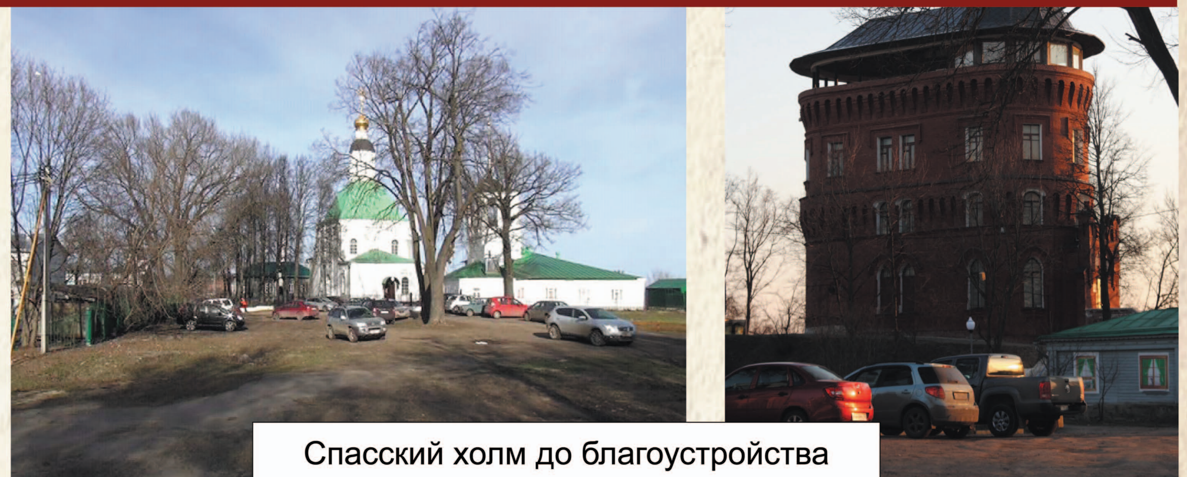
Спасский холм до благоустройства

Вершина Спасского холма (самая высокая точка древнего города) – бывшая резиденция Андрея Боголюбского – словно предназначена для создания общественно-туристического ядра «Княжеское дворянство». Участок, ограниченный Козловым валом, Патриаршим садом и храмовым комплексом, пока не привлекателен для туристов из-за отсутствия общественно значимого пространства и всесторонних широких подходов от главных улиц и площадей. Сегодня от улицы Большой Московской сюда ведет лишь излом улицы Георгиевской у старой аптеки.